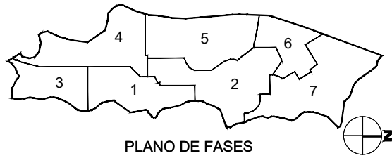
PLANO DE FASES