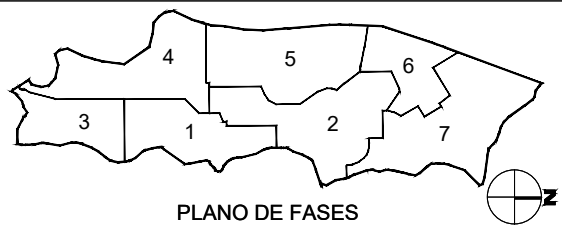
PLANO DE FASES