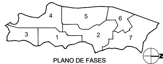
PLANO DE FASES